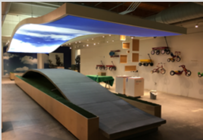
Radio Flyer Corp. HQ - Chicago, IL - USA Cadre - Toile imprimée ciel, rétroéclairée Installation : The Huff Company, Inc