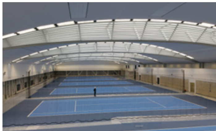
Centre d'entraînement de la Fédération Française de Tennis - Roland Garros - France - Plafond acoustique Architecte : Marc Mimram - Installation : Haguenier