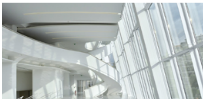
Palais des Festivals de Cannes - FRANCE Plafond acoustique blanc - Installation : Prestations BTP

...des avantages CLIPSO® pour murs et plafonds des lieux publics :