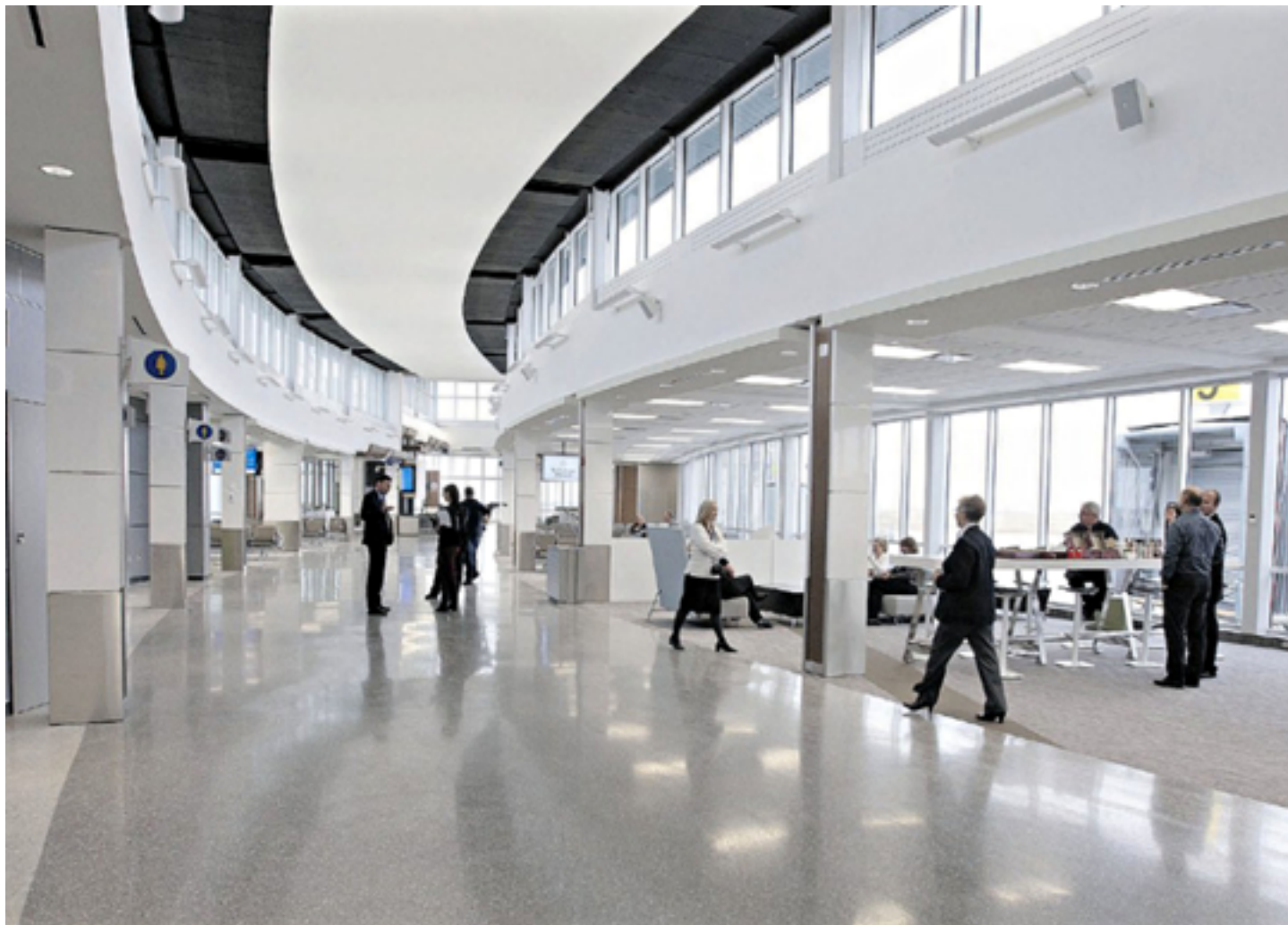
Agrandissement de l'aéroport international de Saskatoon - CANADA Plafonds acoustiques - Architecte : Kindrachuk Agrey Architecture - Installation : Snap-Text Carwest