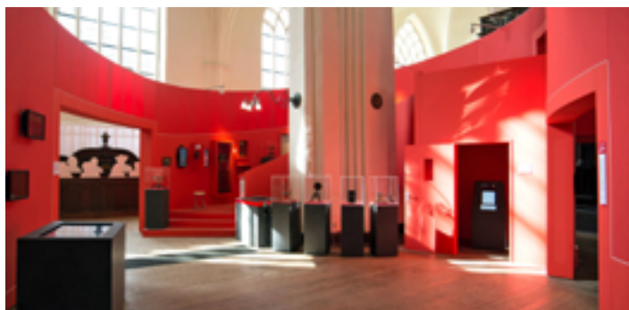
Exposition "400 ans de science", Église Aa-Kerk - Groningen PAYS-BAS - Habillage du stand d'exposition (500m²) - Architecte : Kloosterboer Decor - Installation : City Outdoor Media