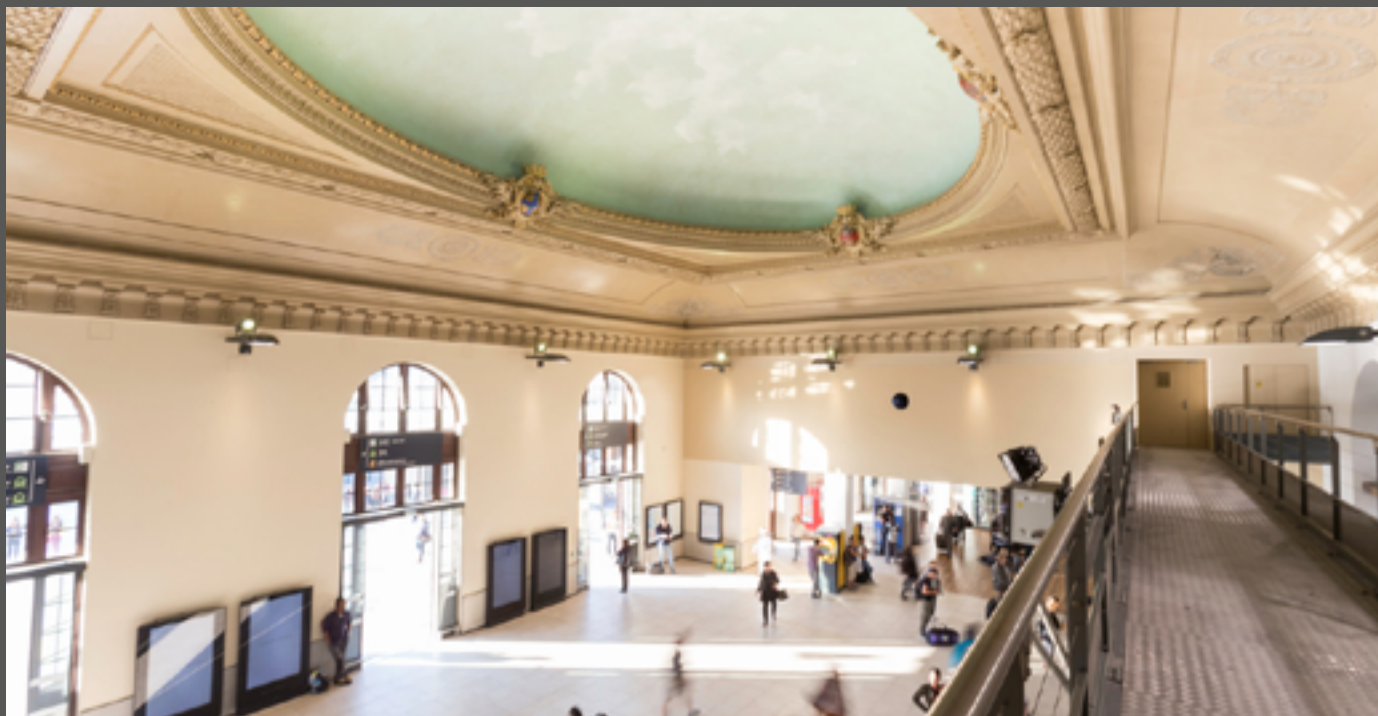
Gare de Nice - FRANCE - Murs acoustiques couleur «Paille» - Installation : CLIBAT

« La rénovation d'une gare génère deux grandes problématiques : permettre l'accueil des usagers pour la continuité du service et travailler au plus propre. Installer des toiles CLIPSO® constituait une réponse globale avec l'assurance d'un temps de pose très court. Fin du fin, l'imprimé acoustique déco a fait son petit effet auprès de la clientèle.