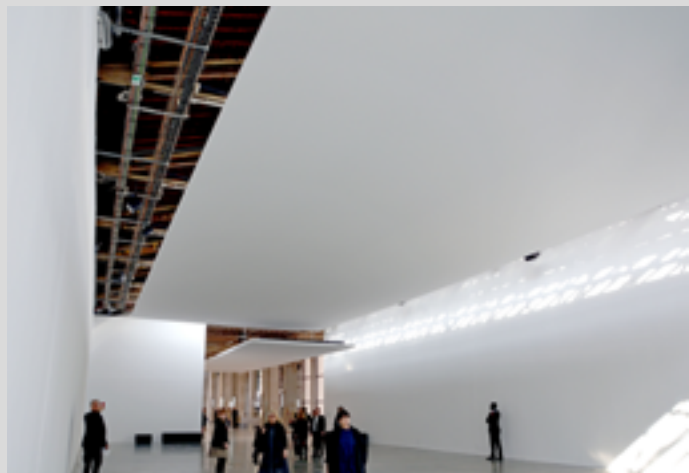
Exposition Anywhere, Anywhere Out of The World au Palais de Tokyo - Paris - FRANCE - Plafonds acoustiques suspendus Artiste : Philippe Parreno - Installation : CLIPSO