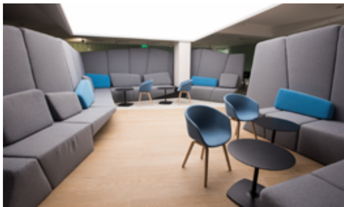
VIP Lounge de l'aéroport de Koltsovo - RUSSIE Toile acoustique blanche et caissons rétroéclairés Installation : CLIPSO UNION

Nous avons pu masquer, par la même occasion, les éléments techniques d'éclairage et protections anti-incendie. Le système de profilés permettra à terme de modifier la décoration à l'infini ! »