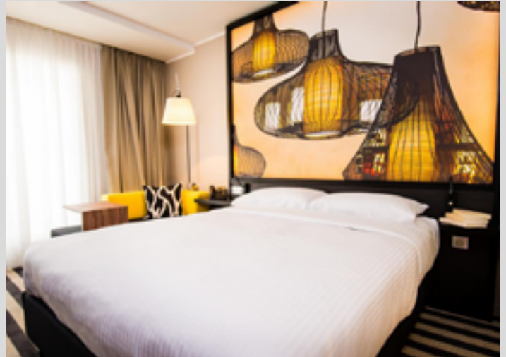
Hôtel Pointe Simon - Martinique - FRANCE Cadres rétroéclairés imprimés - Installation : DL2A