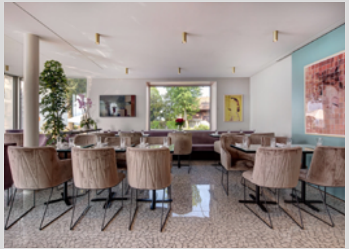
Hôtel du Léman - SUISSE - Plafonds acoustiques couleur blanc Installation : ABRILUM