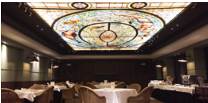
Restaurant - Belgique - Plafond imprimé rétroéclairé Réalisation : MONAVISA

...des avantages CLIPSO® pour murs et plafonds en hôtels et restaurants :