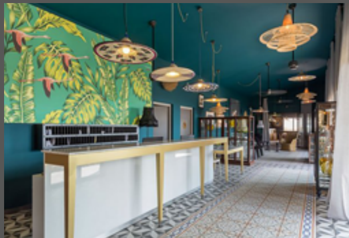
Hôtel Dina Morgabine Hermitage - La Réunion - FRANCE Cadre mural imprimé - Installation : Côte Bleue Installation