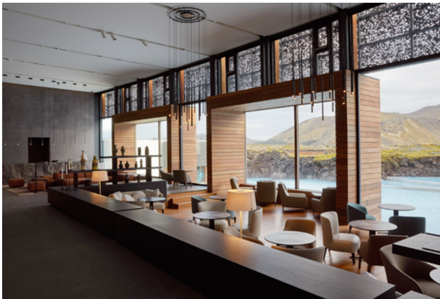
Hôtel Blue Lagoon - ISLANDE - Plafonds acoustiques blanc et couleur - Architecte : Basalt Architects - Installation : ENSO