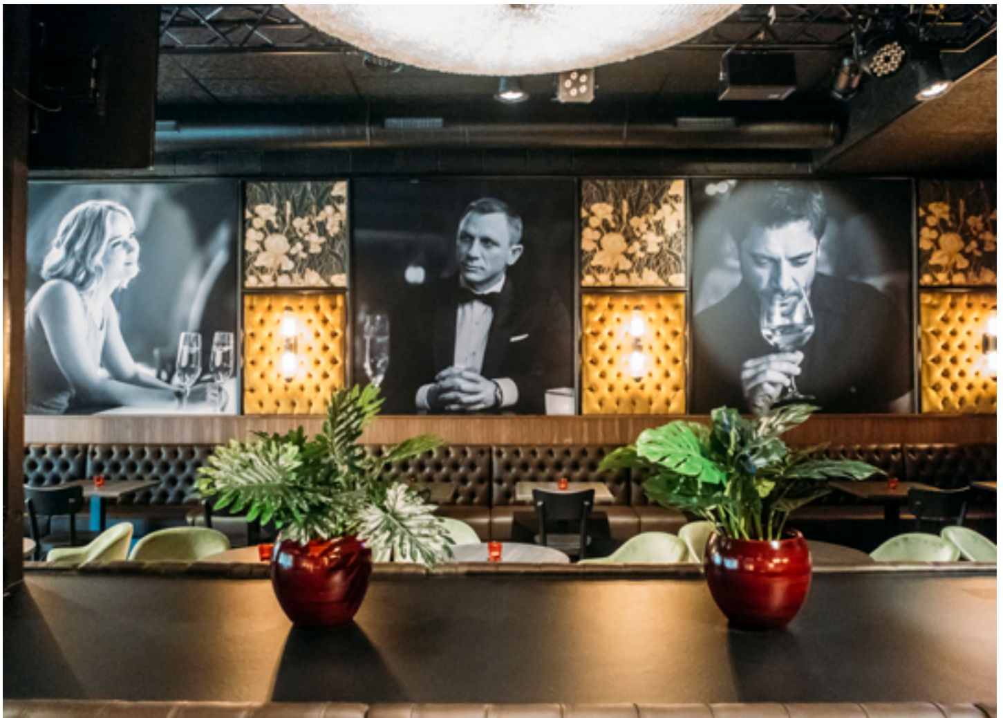
Restaurant Imagix - BELGIQUE - Cadres muraux imprimés noir & blanc - Installation : MONAVISA