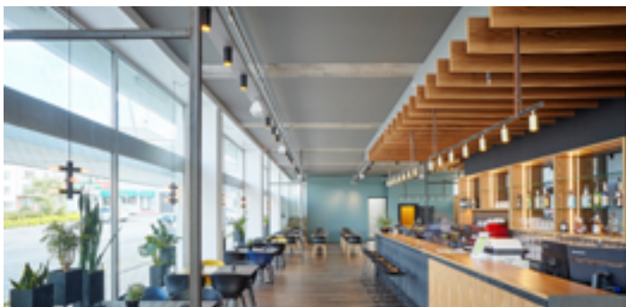
Bar - Restaurant - ISLANDE - Plafond acoustique couleur Installation : ENSO