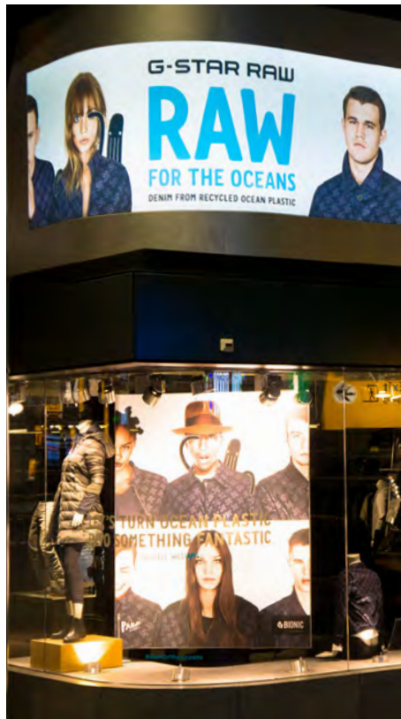
Boutique - Allemagne Caisson fixe incurvé. Ep. 140 mm. Revêtement imprimé.