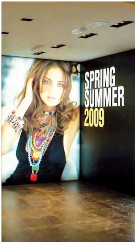
Magasin de prêt-à-porter - PORTUGAL Cloison imprimée rétroéclairée Réalisation : L2 Spirit

Plafond acoustique couleur «Terracotta» effet 3D Installation : Art Cover