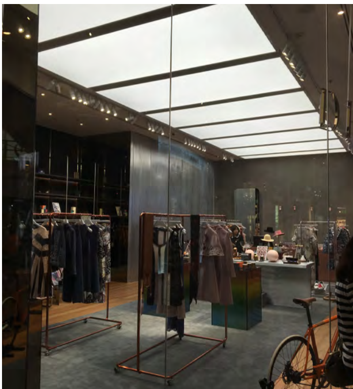
Boutique - THAÏLANDE