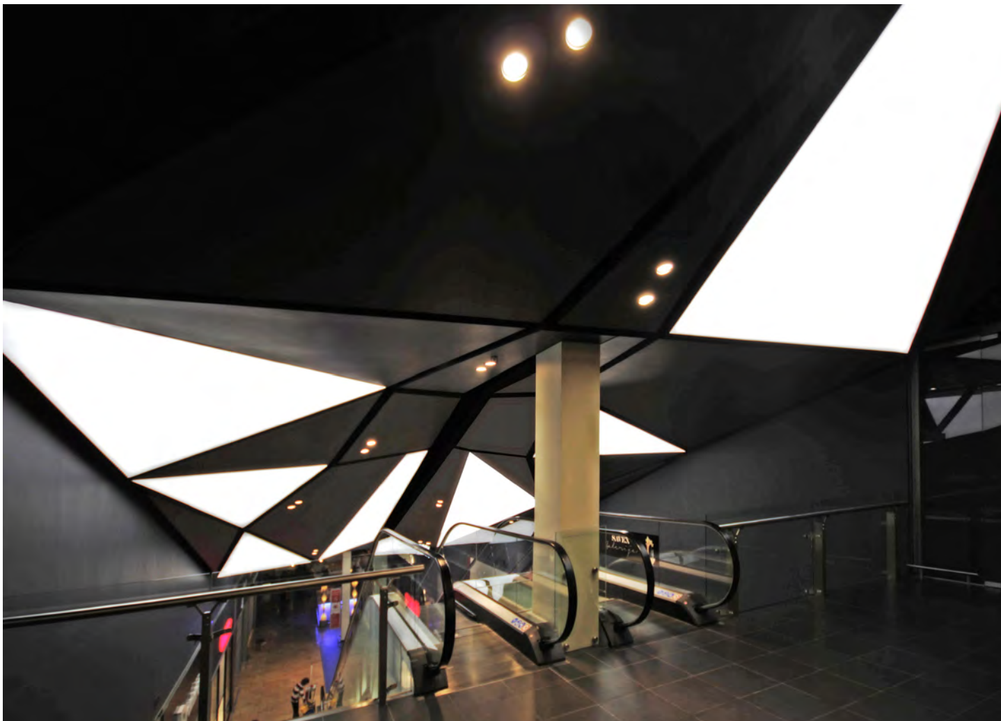
Armageddon, Centre Commercial Akropolis - Vilnius - Lituanie

Plafonds translucides rétroéclairés - Architecte : Performa Architectural Studio - Distribution, installation : JSC Tonas & JSC Swiss System